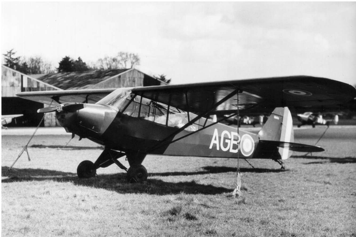
L-18C du GAOA N°8 à Buc. (photo X, via Michel Salmon).