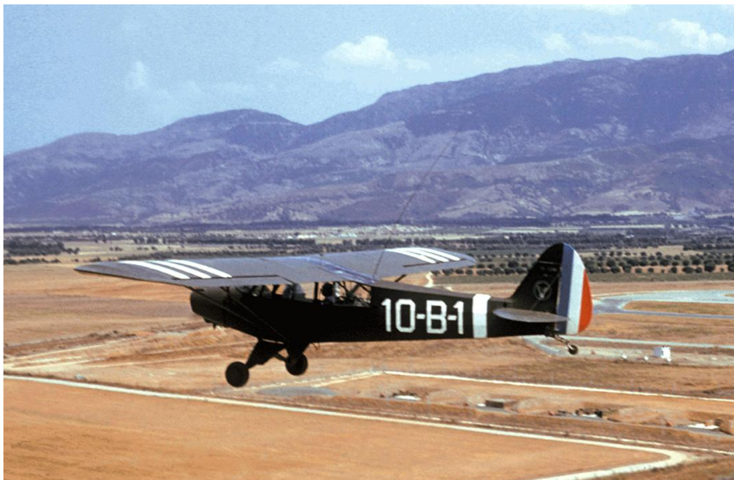
Blida décollage en piste 07 du Piper L-18C, codé 10-B-1, pour réservistes ALAT et CAPM 14.