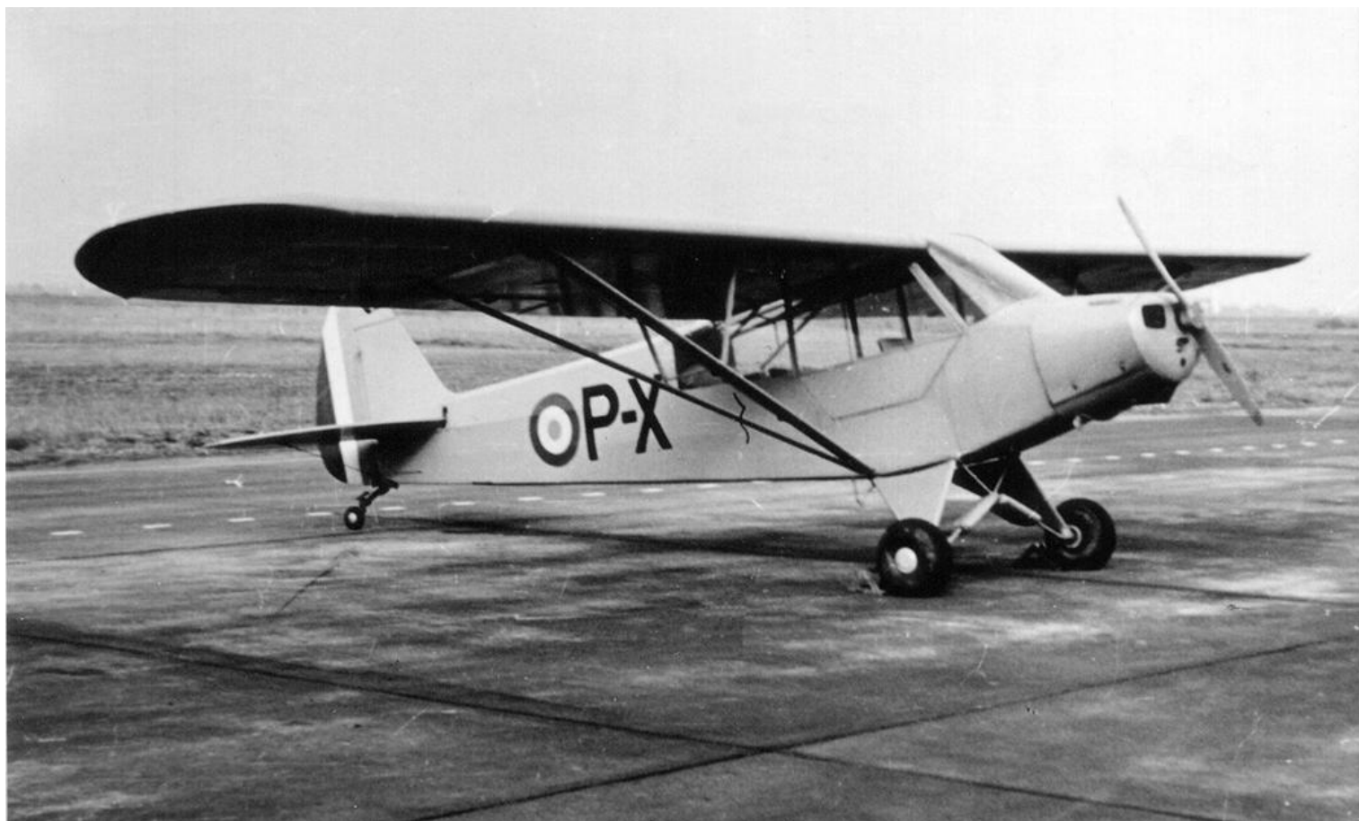
L-18C, codé P-X su GAOA N°2.