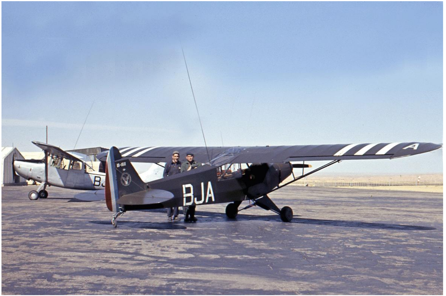
PMAH 7 e DLB, en 1960, à Tébessa, L-18C n° 18-1611/BJA.