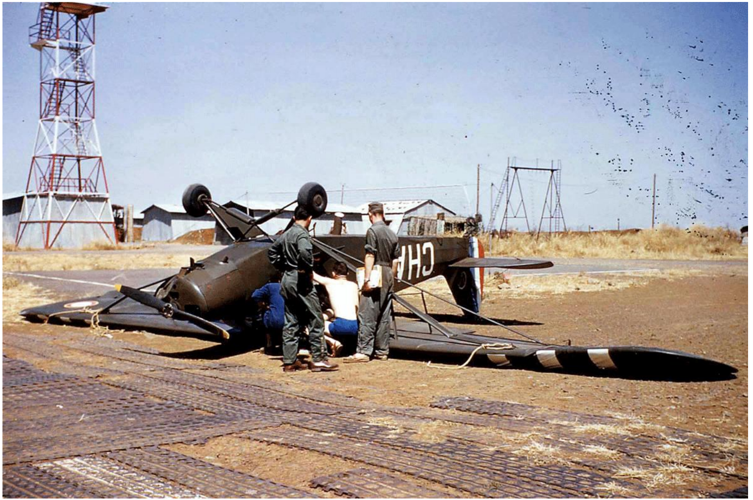
L-18C n°18-1651/CHA, du GALAT N°3, à Bir Rabalou, en juillet 1960.