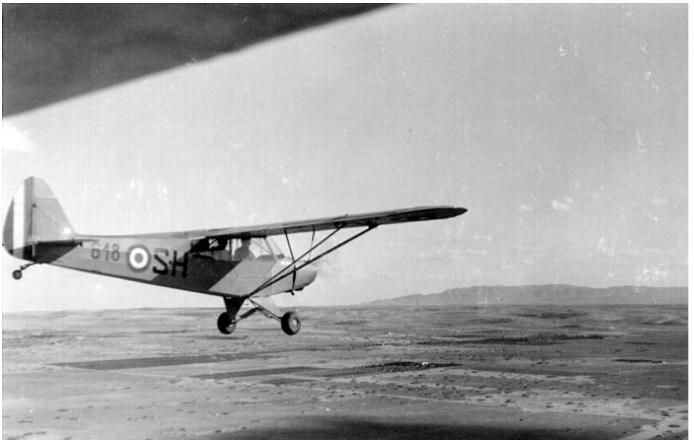
Deux vues en vol du Piper L-18C n°18-1618/SH du GAOA N°5.