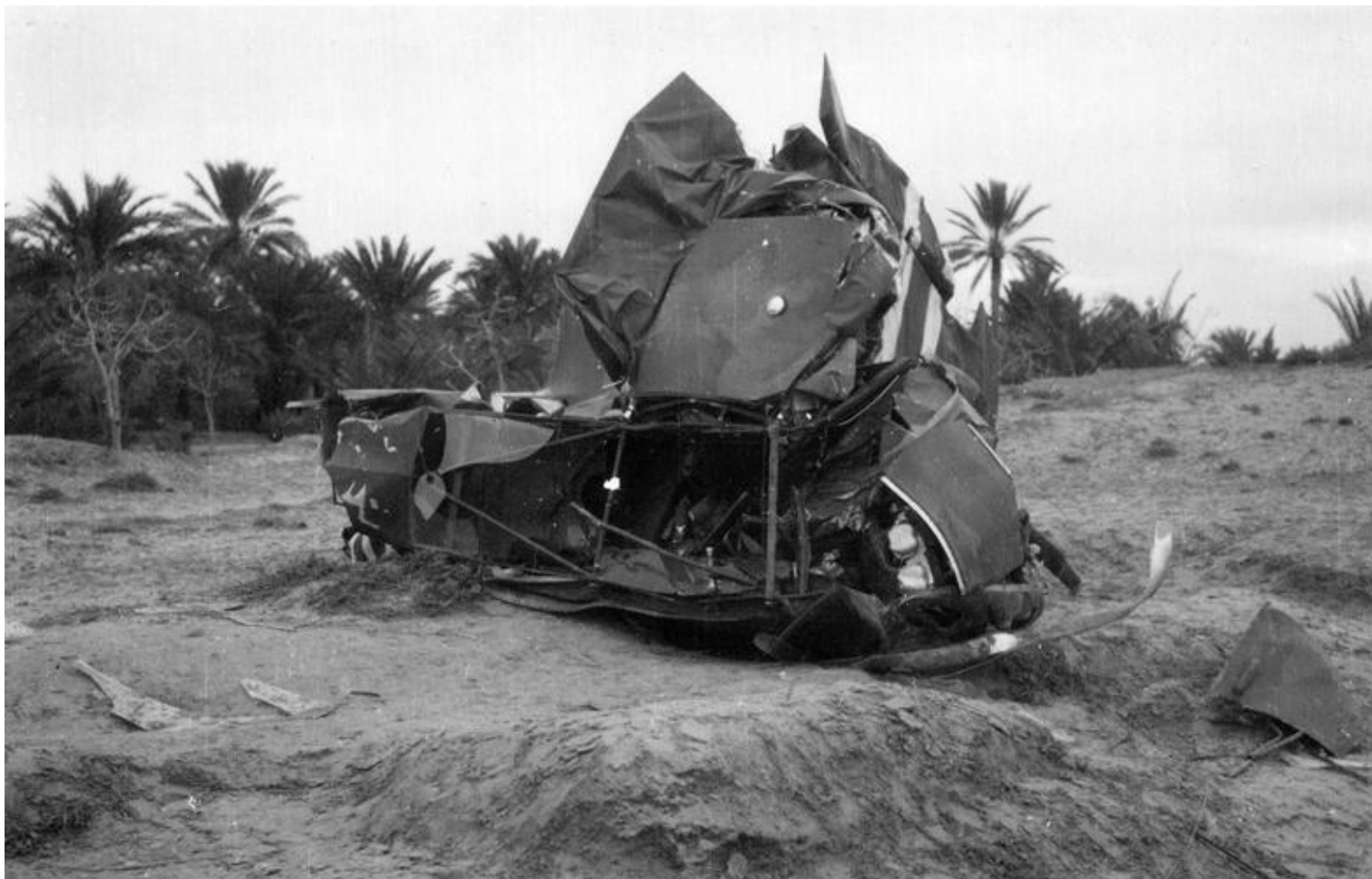
Le Piper n°18-2098, du GALAT N°5, s'écrase, le 10 janvier 1958, à cinq kilomètres au sud de Gabès. Le capitaine Pierre Mimet, pilote, et l'adjudant-chef Deschamps, des transmissions de Tunisie, sont tués.