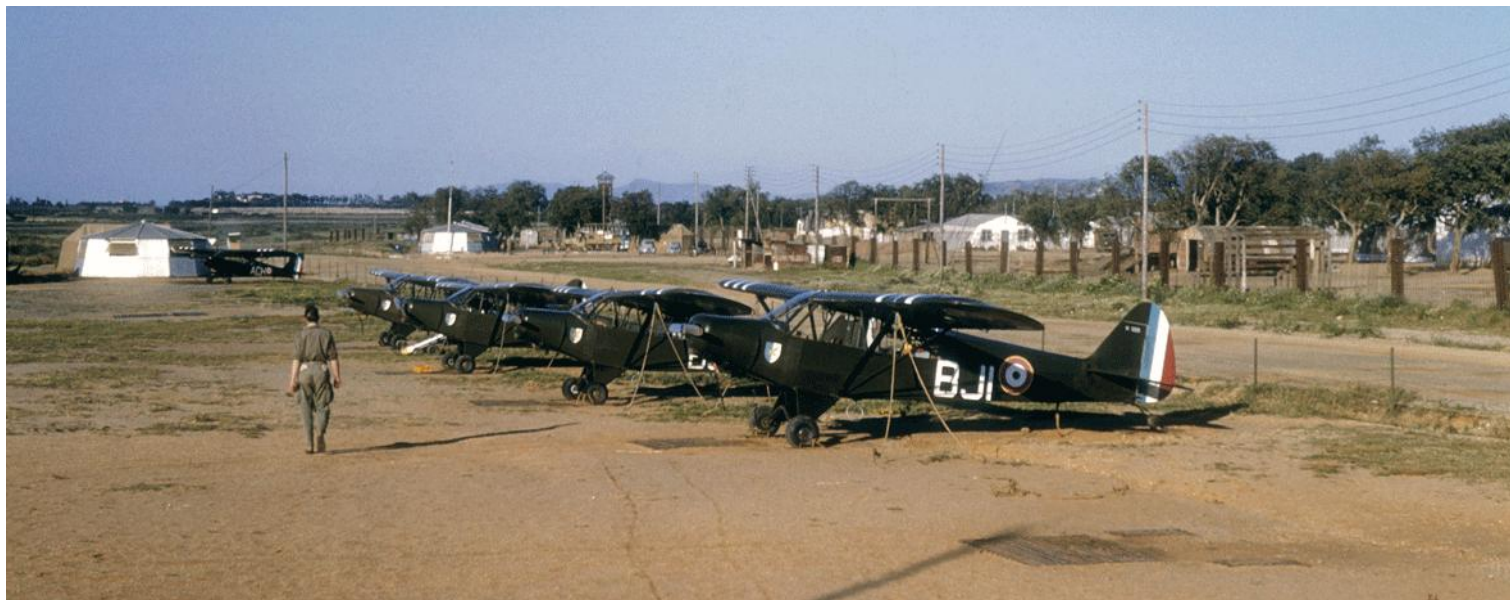
PA de la 7 e DMR à La Réghaïa en 1958

18-1650 51-15650 ../04/52 GAOA N°3 .. /04/53 (../06/53) (07/04/55) (18/06/56) GAOA N°3 AQY (13/02/58) GAOA N°3 ANO (05/08/58) 2° PA/12° DI 22/08/59 22/08/59 détruit à 50%, passible du 4 e échelon ../10/62 retour d'Algérie GALAT N°8 12/11/62 9° GALAT 04/03/64 24/08/65 13/11/64 AIA Clermont-Ferrand, annexe de Vichy installation d'un poste radio TRAP 26, avec modification capot ES .ALAT 26/08/65 22/05/67 MAM Valence (05/12/67) 01/12/67 retiré SMA 20/12/67 réformé avec .... heures 18-1651 51-15651 ../04/52 GAOA N°3 .. /10/52 (../06/53) (23/02/54) GALAT N°3 (01/07/60) CHA (06/01/60) 01/07/60 détruit à Bir Rabalouà 70% ../.../.. réformé avec .... heures 18-1652 51-15652 ../04/52 GAOA N°5 SU (21/10/55) GIA N°5 .. (17/04/57) ../12/57 envoi en métropole Montauban ../06/58 envoie en Algérie 2° PA/ZOS 22/01/61 BRH 676 CRALAT 22/01/61 ../10/62 retour d'Algérie Bruz GALAT N°6 4° GALAT 19/12/63 Montauban 29/01/65 AIA Clermont-Ferrand, annexe de Vichy installation d'un poste radio TRAP 26, avec modification capot Bruz 13/07/65 9° GALAT 29/06/67 01/08/68 Montauban ES .ALAT 28/08/68 02/10/68 Montauban ES .ALAT 06/01/69 21/03/69 ERGM Montauban (../12/69) 29/12/69 réformé avec .... heures 18-1653 51-15653 ../04/52 GAOA N°3 .. /10/52 653 o SB GAOA N°3 (../06/53) 2° PA/ZOS 05/11/60 BRF 05/11/60 détruit à 80% à El Abiod. ../.../.. réformé avec .... heures