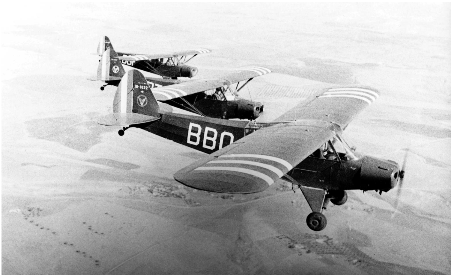
L-18C n°18-1622/BBQ, de l'escadrille observateurs de l'EA.ALAT à Sidi-bel-Abbès, en 1961 (photo Jean Garros).