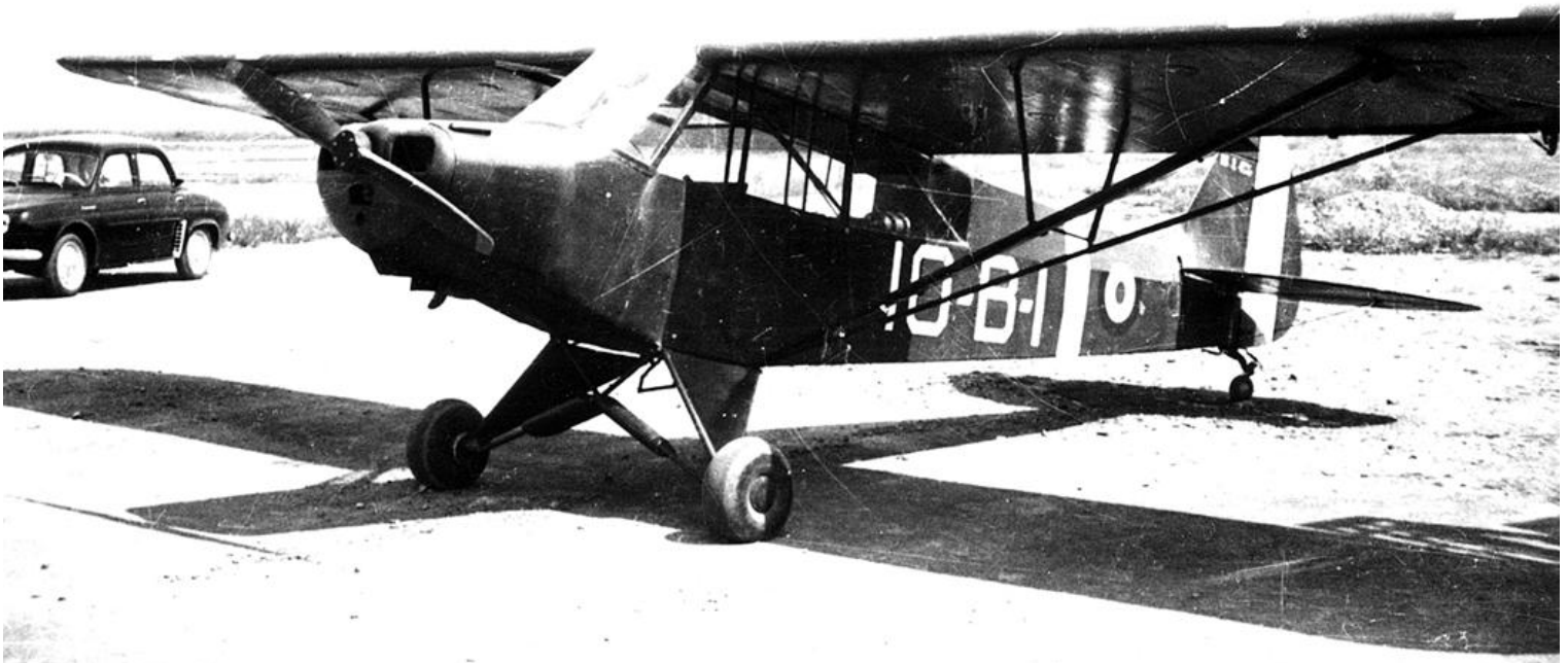
Blida, L-18C destiné à l'entraînement des réservistes, mis à la disposition de l'AC Blida en 1955.