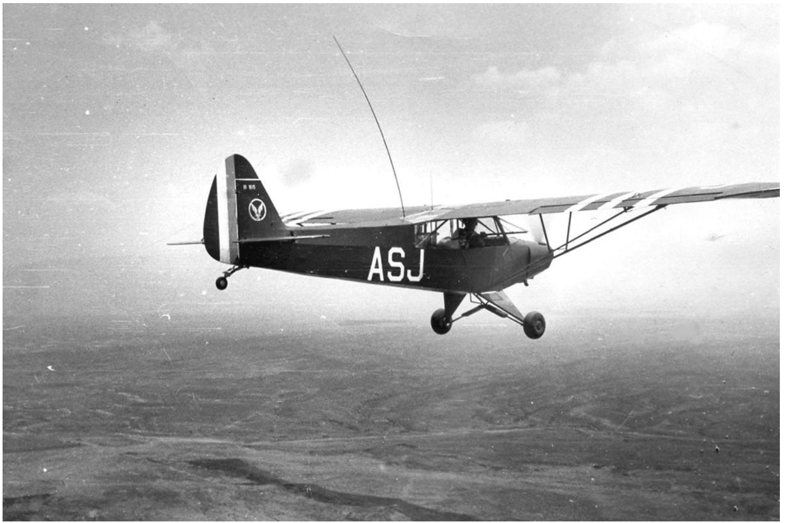
L-18C du 2 e PA de la 19 e DI, à M'Sila, au défilé du 14 Juillet 1959.