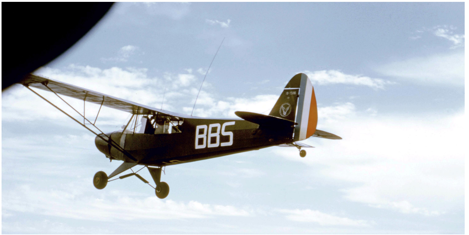
EA.ALAT, à Sidi-bel-Abbès, en 1961, le L-18C n°18-1586/BBS.