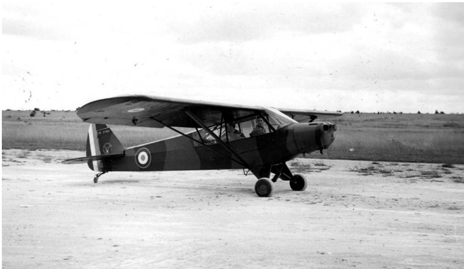
Dax, Piper L-18C n°18-2102 de l'ES.ALAT.