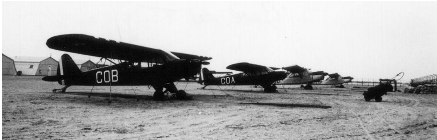
3 e PA/ZES, Touggourt, 1962. Les Piper L-18C (n°18-1591/COB et n° 18-1499/COA) arrimés en vue de l'arrivée prochaine d'un vent de sable (photo Alain Schlauder).