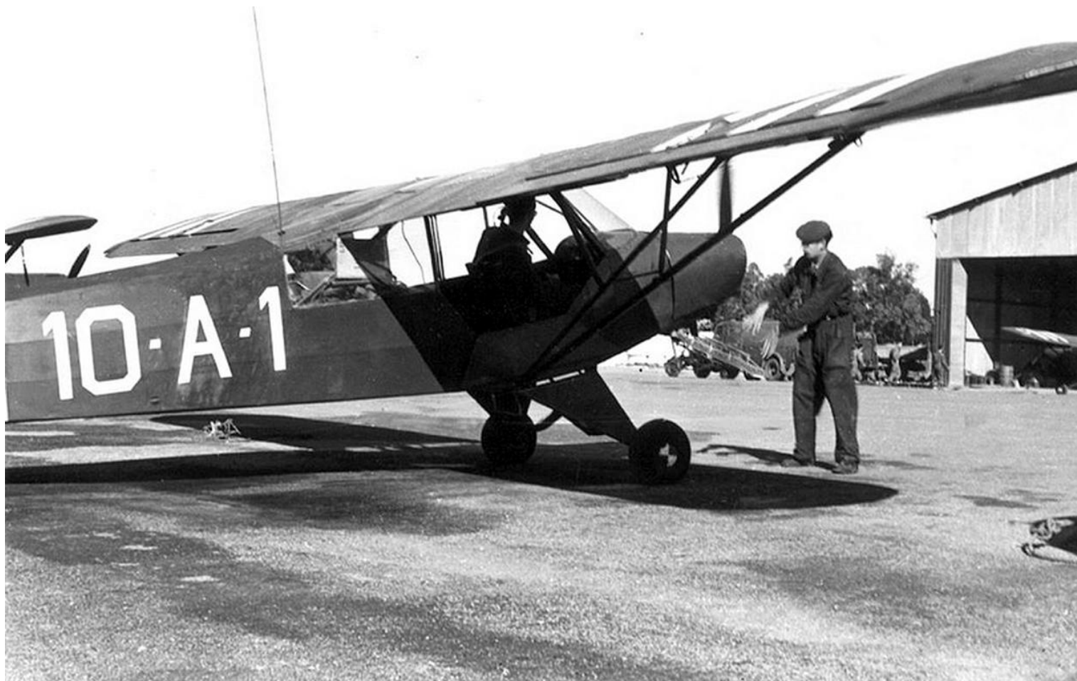
Piper L-18C, mis à la disposition de l'aéro-club d'Alger.