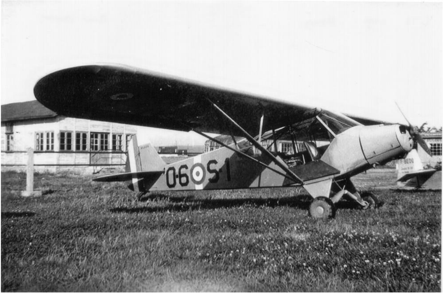
L-18C du GALAT N°1, codé 0-6 S-1, en aéro-club à Nancy. (photo Marcel Vervoort).