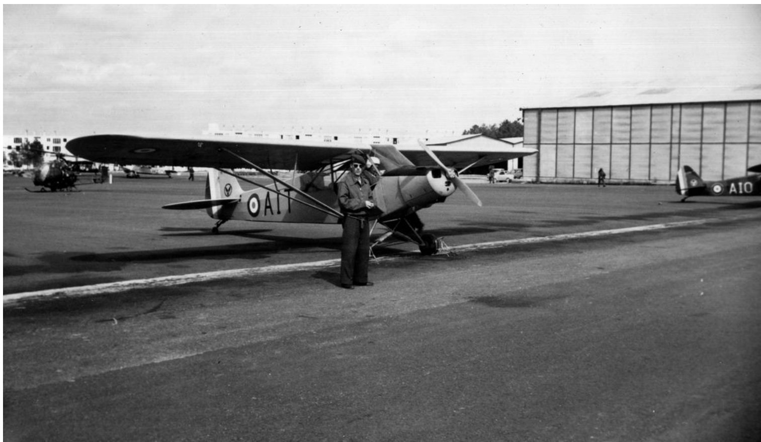
L-18C, codé AIT, de l'ES.ALAT, à Dax, stage 6P-59..