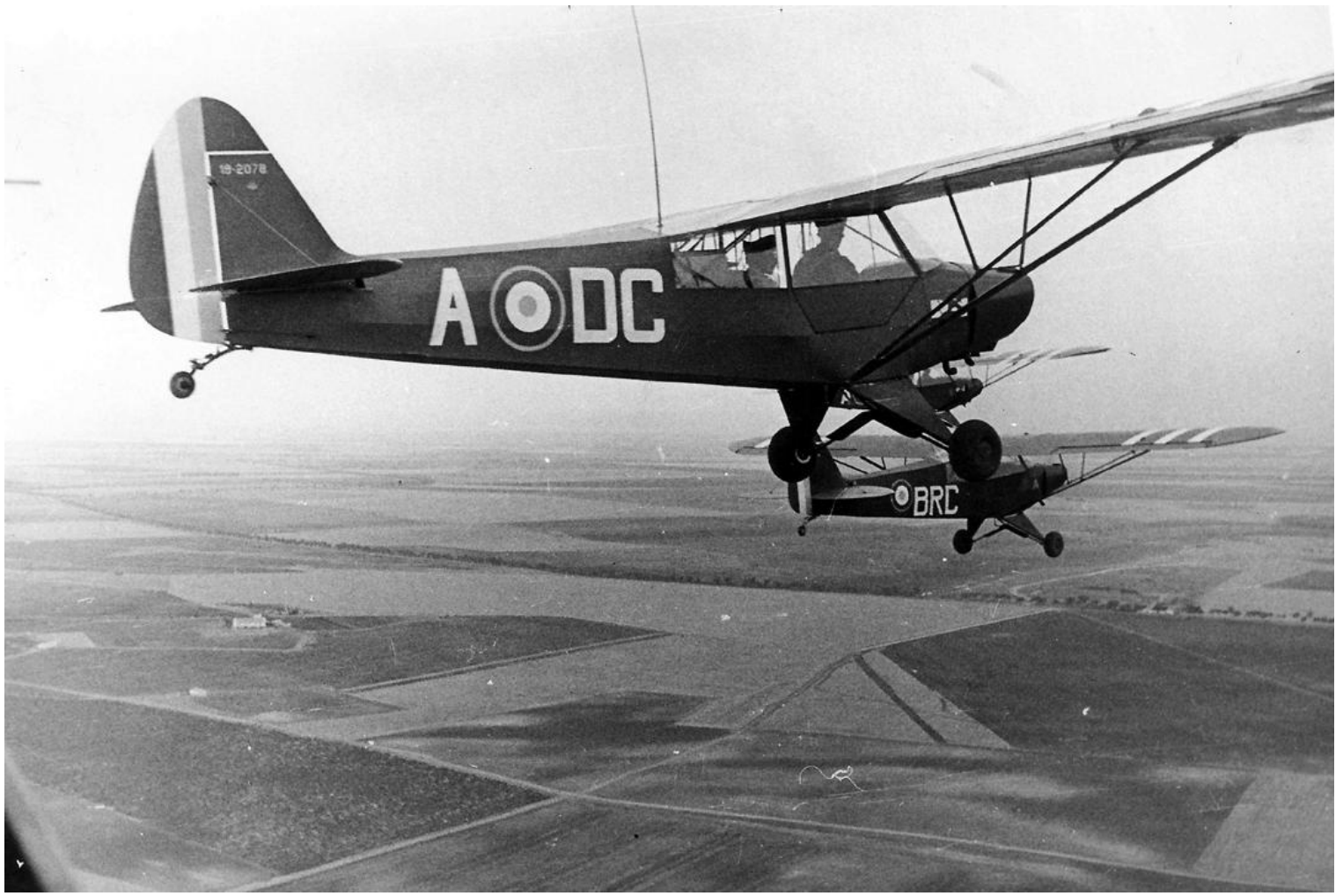
Sidi-bel-Abbès en 1960, Piper L-18C n°18-2078/ADC du 2 e PMAH de la 13 e DI.