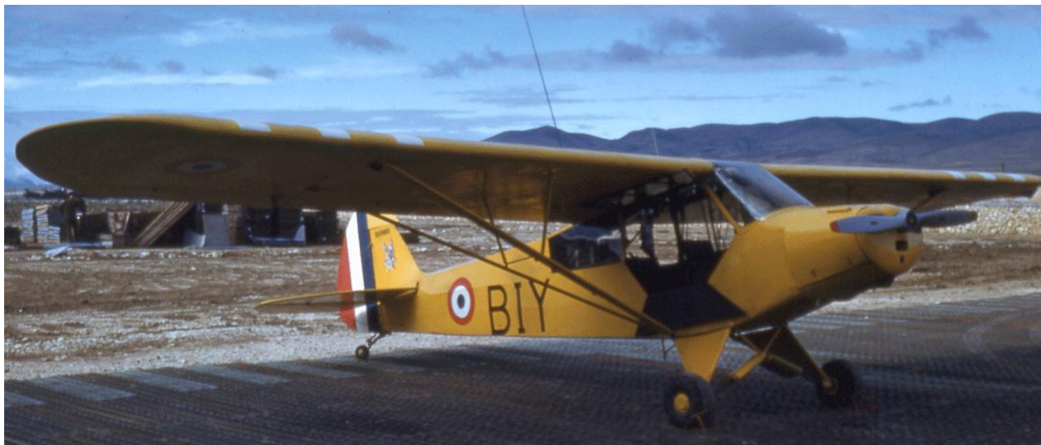
Piper L-18C, codé BIY, du 2° PA de la 2° DIM, sur le parking de Tébessa. (photo Yves Quiniou).

18-2104 52-2504 ../.. /52 GAOA N° 6 24/07/55 21/04/56 EJ (20/08/55) Sétif 21/04/56 ../07/60 PA 14° DI EJ (01/05/56) retour d'Algérie Montauban ES .ALAT (../01/62) Versailles ES .ALAT 23/04/64 16/12/66 672 CRALAT E-EAA 17/07/67 06/01/69 Montauban (03/01/69) 09/01/69 réformé avec .... heures 18-2105 52-2505 ../.. /52 GAOA N° 6 28/07/55 (24/08/55) GAOA N° 6 18/04/56 EK (17/04/56) Sétif 18/04/56 GAOA N° 3 ANT (14/11/57) PA/11° DI 01/06/59 2° PA/12° DI 01/12/59 01/12/59 détruit par une tempête de vent sur le parking de Mécheria. ../.. /.. réformé avec .... heures 18-2106 52-2506 ../.. /52 GAOA N° 6 07/08/55 27/04/56 EL PA/19° DI 27/04/56 EL GAOA N° 3 ANU (04/12/57) PA 10° DP (25/10/60) ../07/62 retour d'Algérie Bruz E-EAA 17/11/62 15/09/65 (../09/64) 29/04/65 AIA Clermont-Ferrand, annexe de Vichy installation d'un poste radio TRAP 26, avec modification capot ERM Valence (20/06/66) 05/11/66 réformé avec .... heures 18-2107 52-2507 ../.. /52 ../.. /.. réformé avec .... heures 18-2108 52-2508 ../.. /52 GALAT N° 3 ANN (12/09/58) GALAT N° 3 22/07/60 CHG (16/01/60) CRALAT 22/07/60 PA 21° DI ../08/62 retour d'Algérie GALAT N° 6 *05/09/62 (../07/63) 15/04/65 AIA Clermont-Ferrand, annexe de Vichy installation d'un poste radio TRAP 26, avec modification capot GALAT N° 6 (21/05/65) (09/06/65) ERM Valence 31/08/65 (20/06/66) 05/11/66 réformé avec .... heures