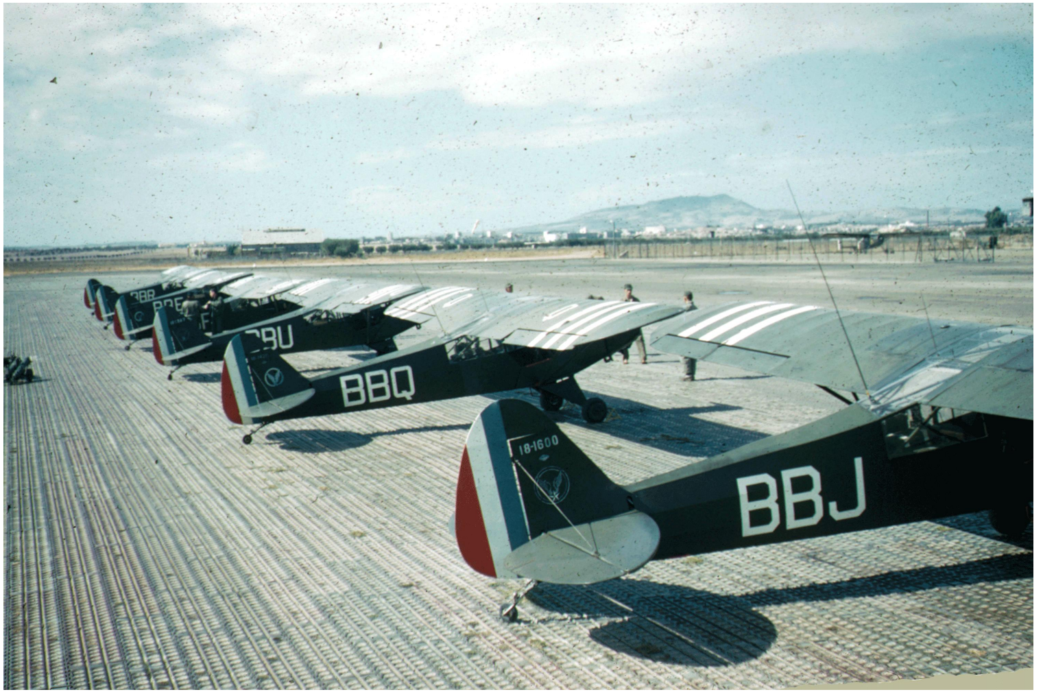
EA.ALAT de Sidi-bel-Abbès, en 1961, au premier plan, L-18C n° 18-1600/BBJ.