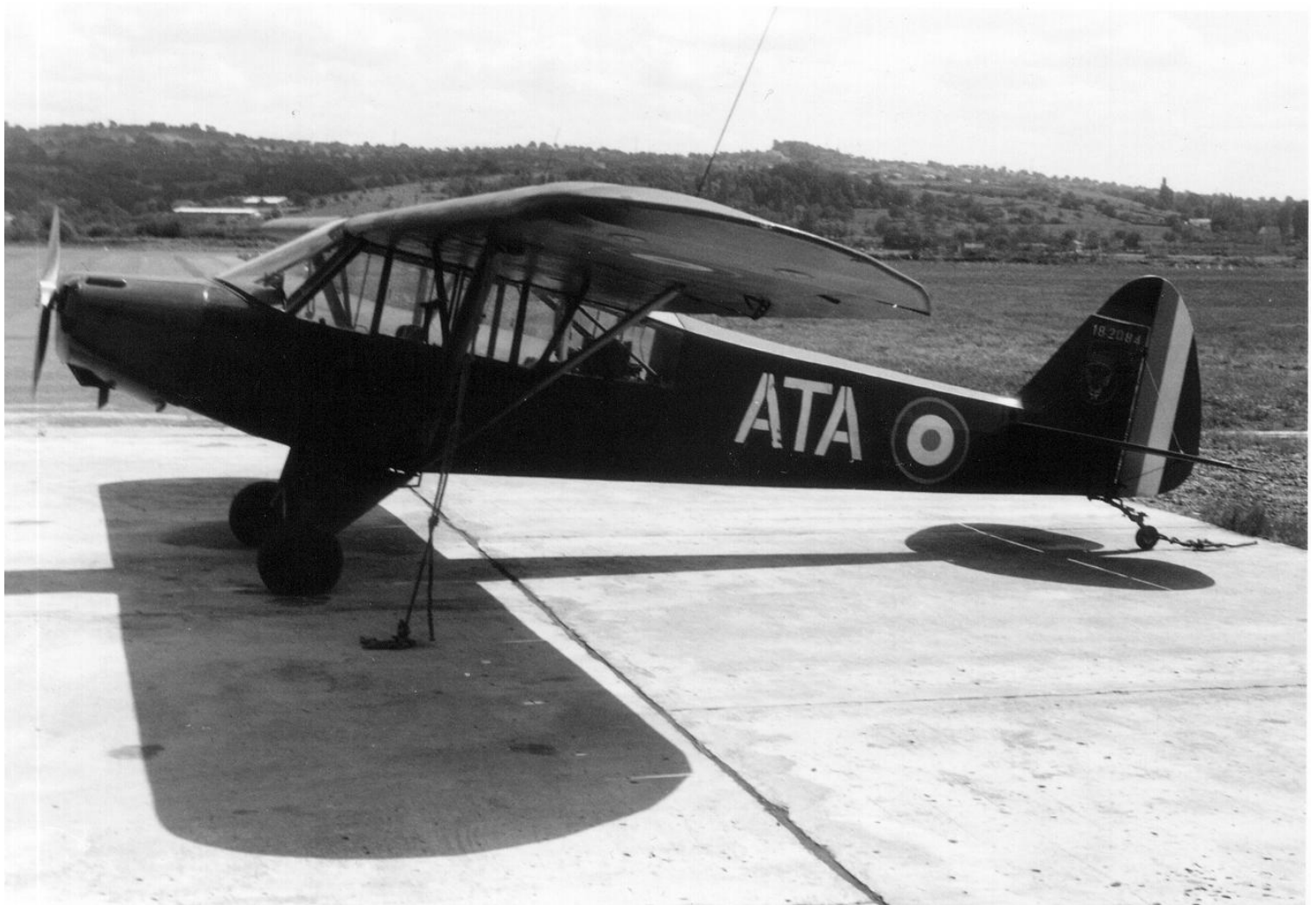
Piper L-18C n°18-2084/ATA, du GALAT N° 9.