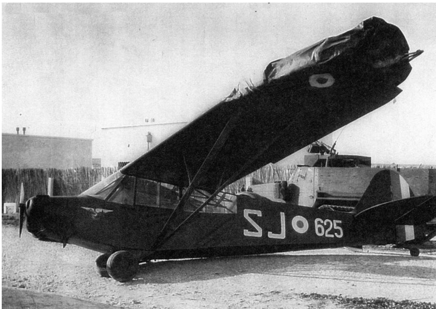
L-18C n°18-1625/SJ, accidenté à Kasserine, le 18 février 1957, équipage Granet et Mares.